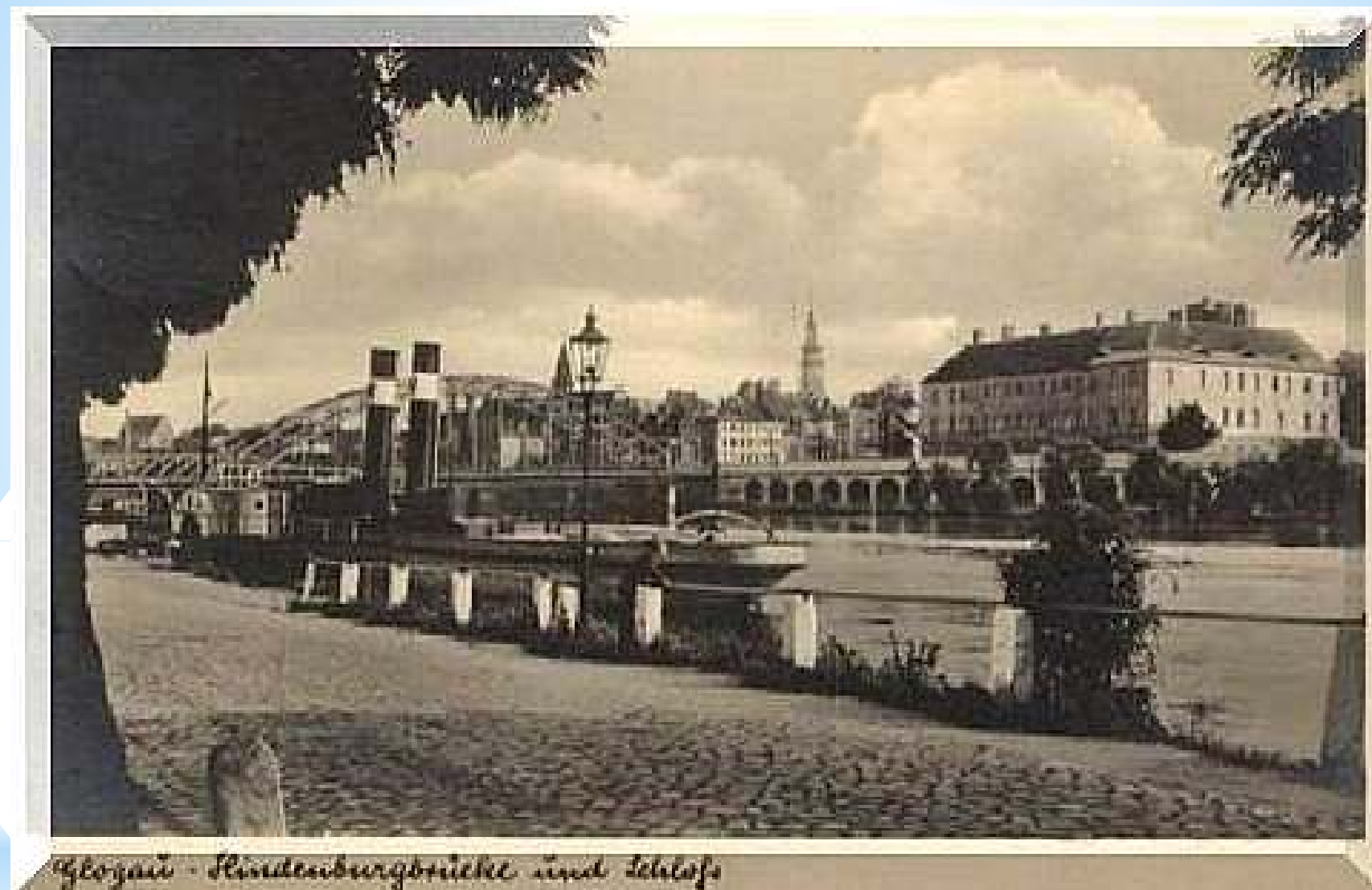
Plac Kolo Kolegiaty - Hradoburgonické ústí a šlofo